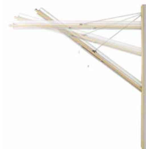
Sistema movimento anta basculante